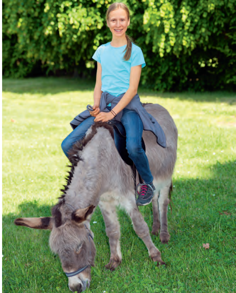
↑ GEMÜTLICHER AUSRITT: Erfahrungen im Umgang mit dem Langohr sammeln Kinder auf dem Tollhausener Eselhof.

Die Ausstellung ist dienstags bis freitags von 14 bis 18 Uhr geöffnet sowie an Wochenenden von 12 bis 18 Uhr. Der Ausstellungsbesuch im Hochschloss ist im Parkeintritt (9 Euro für Erwachsene, 6 Euro ermäßigt, 1,50 Euro für Kinder ab sieben Jahren) enthalten.