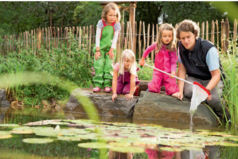
↑ SPANNENDE ENTDECKUNGEN: Spaß für Groß und Klein im Naturparkzentrum Gymnicher Mühle.