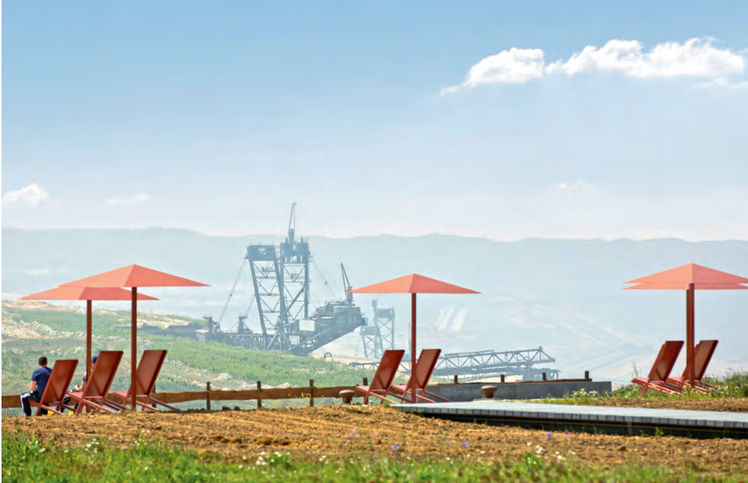
↑ GRANDIOSER AUSBLICK: Unterm Sonnenschirm kann man das Panorama am Tagebau Hambach noch besser genießen.