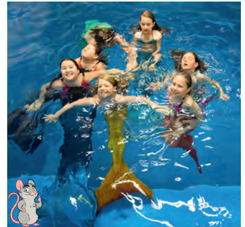
↑ BEGEISTERT: Den sechs Meerjungfrauen macht das neue Hobby sichtlich Spaß.

Am Anfang ist das Schwimmen mit der Flosse nicht ganz einfach. Weil die Bewegung nicht aus den Beinen, sondern aus der Hüfte kommt, muss man sich im Wasser umgewöhnen. „Doch Kinder lernen schnell.“ Schon nach wenigen Übungen tauchen die Mädchen scheinbar schwerelos durchs Wasser – Rolle vorwärts, Rolle rückwärts, Handstand. Nach zwei Stunden sind die jungen Taucherinnen nicht mehr von einer richtigen Meerjungfrau zu unterscheiden. Als