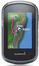
1. Preis: Garmin eTrex Touch 35 Fahrrad-Navi