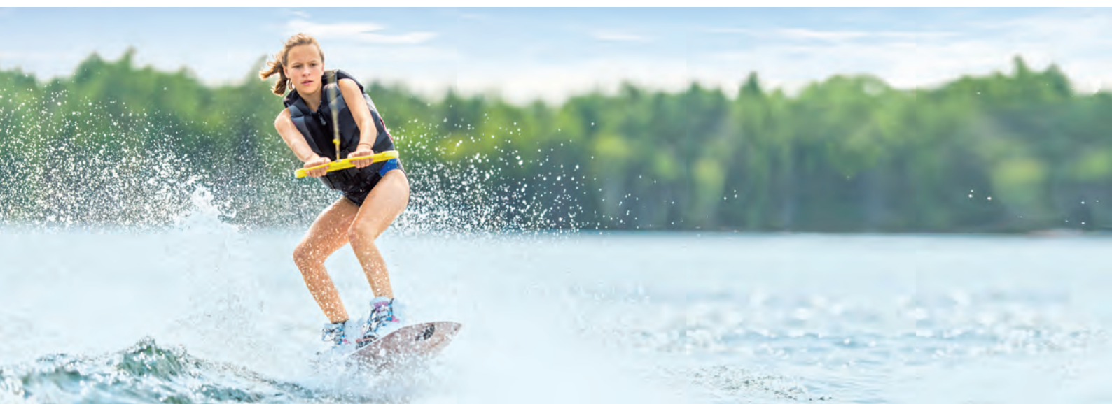
↓ LOCKERE GRUNDSPANNUNG: Auf Wellen und Kurven muss man beim Wasserski auf dem Bleibtreusee schnell reagieren.