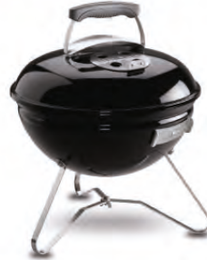
2. Preis: Weber, tragbarer Holzkohlegrill