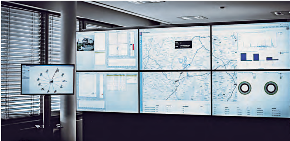
↑ QUIRINUS. Testleitstand-Demonstrator für das „Virtuelle Kraftwerk“.

Elsdorf. Quirinus: Das ist der Name eines innovativen Kraftwerksprojekts, an dem RWE Power beteiligt ist. Im Mittelpunkt des Förderprojekts steht ein sogenanntes regionales Flächenkraftwerk. Das virtuelle Kraftwerk existiert nur als Rechenergebnis einer Software, die zunächst testweise in der Region an Erft, Rur und Inde Angebot und Stromnachfrage, Einspeisung sowie Netzlast regelt und ausgleicht. Der Leitstand ist dagegen Realität: Er steht im Eisdorfer Ortsteil Heppendorf bei der Firma SME Management. Von dort aus sollen Stromerzeugungsanlagen und -verbraucher sowie Speicheroptionen miteinander verschaltet werden – mit dem Ziel, das