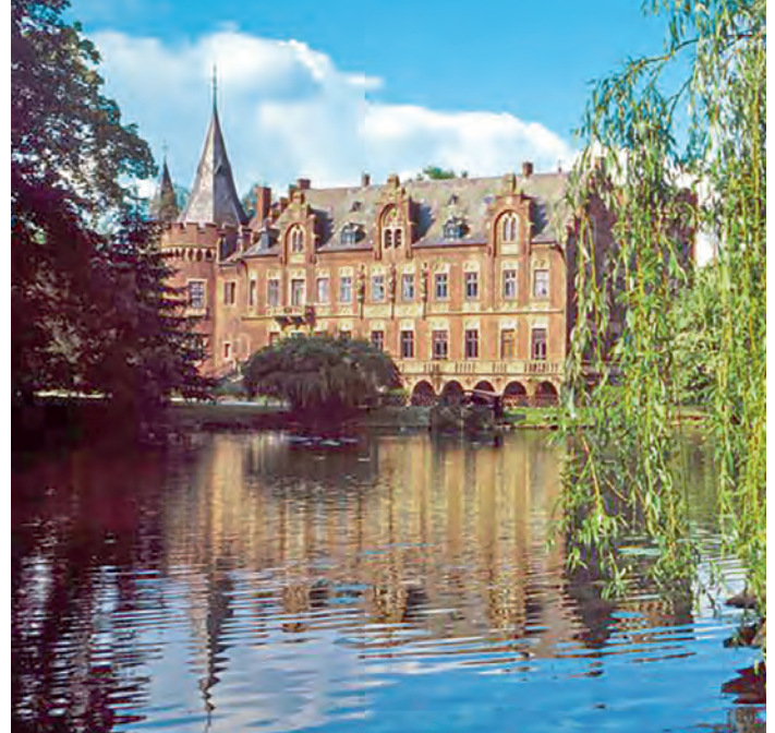
↑ INTERESSANTE DAUERAUSSTELLUNG: Im Schloss Paffendorf lernen die Besucher viel über die Kohle und ihre Nutzung.