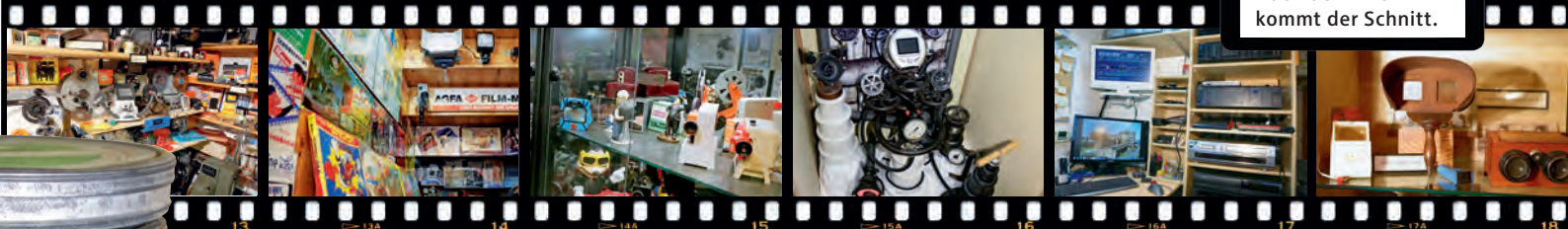
↑ DIE SCHMALFILM-AUSSTELLUNG im Keller seines Hauses birgt so manchen Schatz.

zwölf Steinzeugwerke geblieben sind, was mit den fünf Brikettfabriken passierte und warum von den ehemals gut 30 Schornsteinen nur noch sechs stehen. Dabei kennt Kleinen ja alle Antworten. Selbst wenn ihm mal ein Detail nicht einfallen würde, ein Blick in sein Archiv würde reichen, um es wieder präsent zu haben.