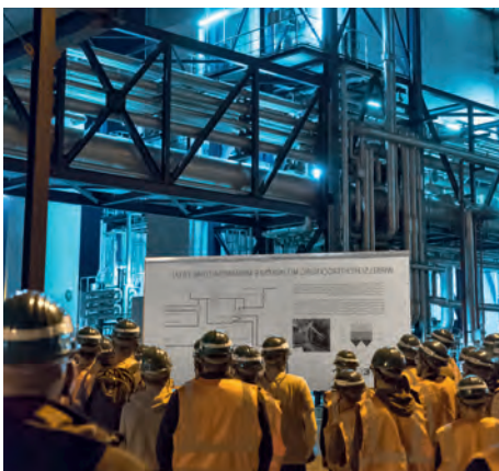
↑ BESUCHER im Kraftwerk Niederaußem.

Rheinisches Revier. 45.000 Besucher haben 2016 an Führungen durch die Betriebe und Rekultivierungsgebiete von RWE Power teilgenommen. Damit haben in den letzten zehn Jahren über 500.000 Menschen RWE Power besucht.