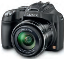
1. Preis: LUMIX DMC-FZ72EG-K Premium-Bridgekamera