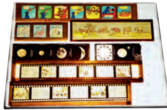
↑ VERSCHIEDENE Laterna-magica-Glasbilder, die an die Wand projiziert werden können.