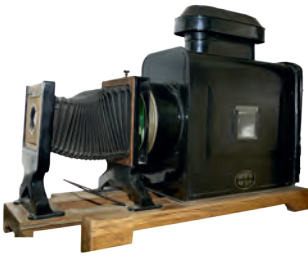
↑ SAMMLERSTÜCK: Ein Bildwerfer (heute Projektor) für Glasbildplatten, circa 1910.