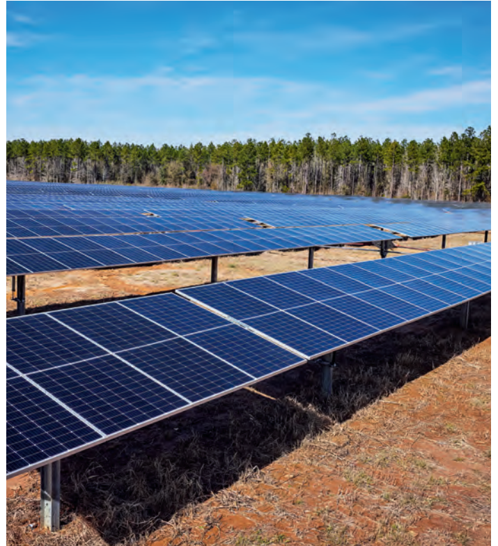
Zukunftsfeld Erneuerbare Energien: RWE setzt in den USA auf Wachstum.

Mit der Zusammenführung von RWE und CEB verdoppelt sich nahezu die installierte Leistung des Unternehmens in den USA auf 7,2 GW. Gleichzeitig ist RWE damit in den meisten US-Bundesstaaten präsent. Die kombinierte Projekt-Pipeline von mehr als 24 GW in den Bereichen Onshore-Wind, Solar und Batterien bildet eine der größten Entwicklungsplattformen für Erneuerbare Energien in den Vereinigten Staaten. Zudem treibt RWE auch in den USA den Ausbau der weltweiten Offshore-Windaktivitäten im Rahmen der Growing-Green-Strategie voran. Der Kauf von CEB kommt als zusätzliche Investition zu den Wachstumsplänen von RWE hinzu.