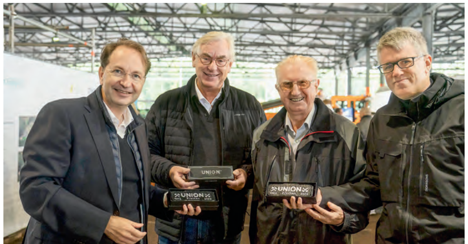
Das letzte Union-Brikett erinnert an die Geschichte des Traditionsstandorts Frechen.

übernehmen neue Aufgaben. Aus guter alter Tradition ist das letzte Union-Brikett ein Sonderbrikett. Es erinnert mit den Jahreszahlen 1902 und 2022 und dem Bergbausymbol Schlägel und Eisen an die grandiose Geschichte der Briketts vom Wachtberg.