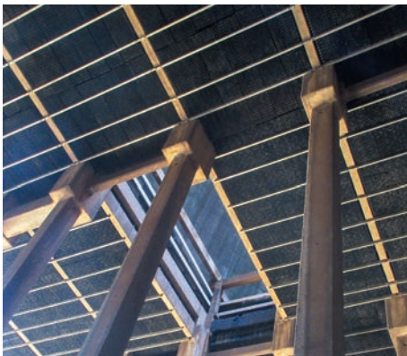
Blick von unten auf die Kühlwasserverteilungsebene

Nach dem Ausbau der Kühlturmeinbauten ergibt sich ein freier Blick vom Boden des 160 Meter hohen Kühlturms, der sogenannten Kühlturmtasse, Richtung Himmel.