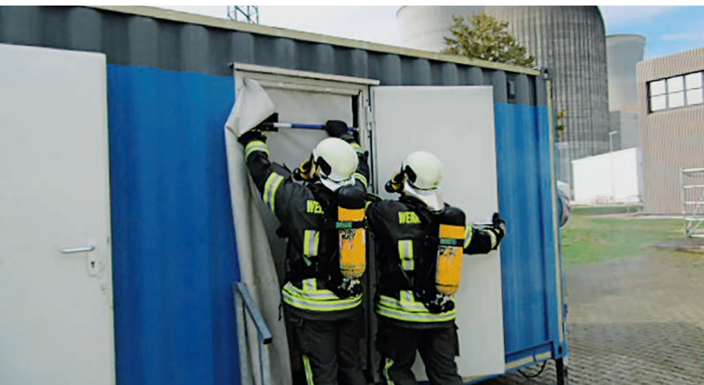
An einem Brandübungscontainer werden unterschiedliche Situationen simuliert, um die Feuerwehrfrauen und -männer auf den Ernstfall vorzubereiten.