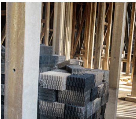
Ausgebaute Verrieselungseinbauten am Boden des Kühlturms