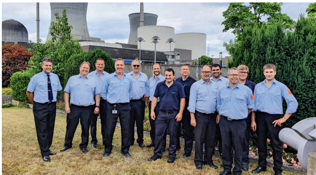
Mitglieder der Werkfeuerwehren aus der Region haben sich in Gundremmingen zum Austausch getroffen.